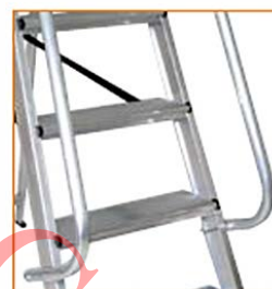
OPCIONAL / OPTIONAL